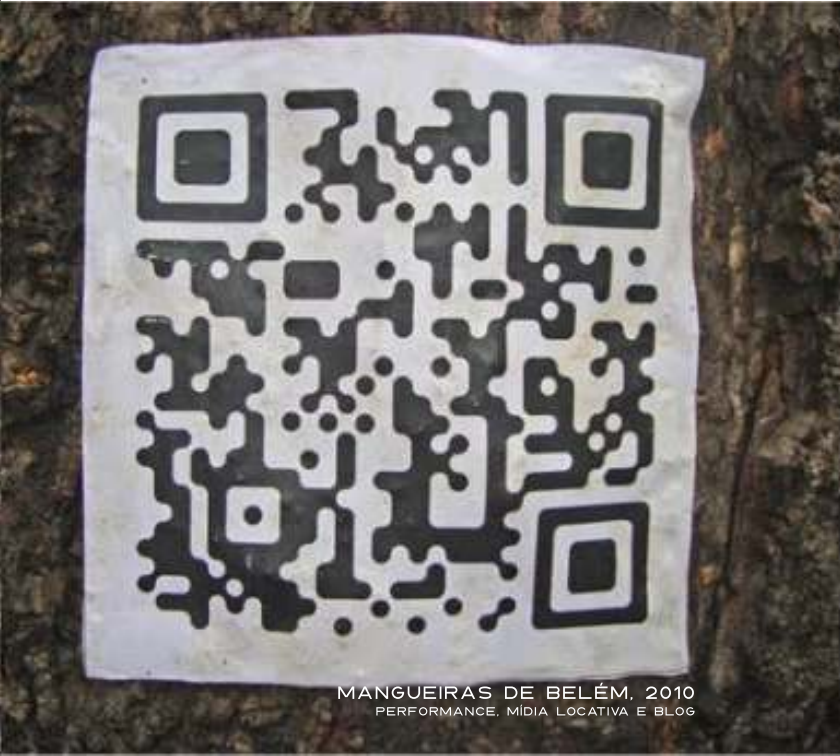
MANGUEIRAS DE BELÉM, 2010 PERFORMANCE, MÍDIA LOCATIVA E BLOG