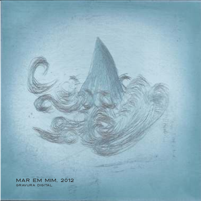
MAR EM MIM, 2012 GRAVURA DIGITAL