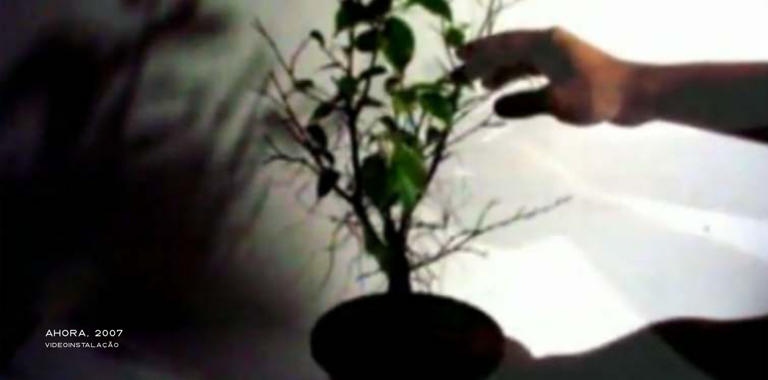
AHORA, 2007 VIDEOINSTALAÇÃO