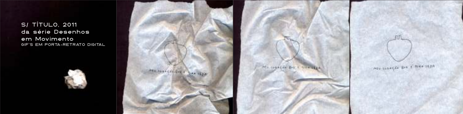
S/ TÍTULO, 2011 da série Desenhos em Movimento GIF'S EM PORTA-RETRATO DIGITAL