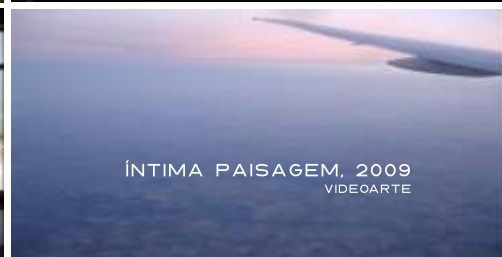
ÍNTIMA PAISAGEM, 2009 VIDEOARTE