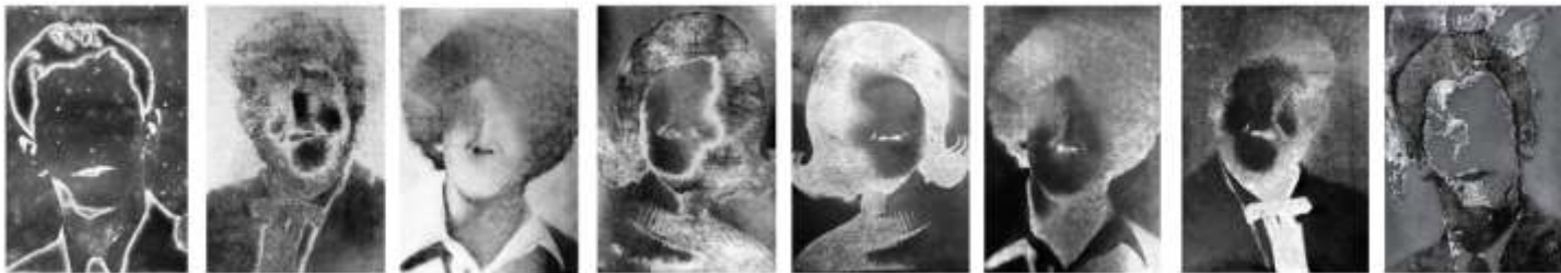
SILVER VARIATION II da série BIOSHOT (acervo da Kamara-Kó Galeria), 2012 IMPRESSÃO DIGITAL EM VINIL METALIZADO