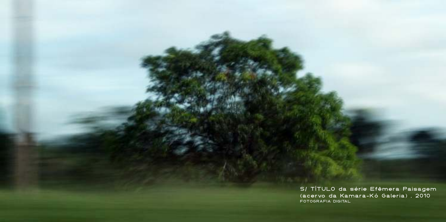
S/ TÍTULO da série Efêmera Paisagem (acervo da Kamara-Kó Galeria) , 2010 FOTOGRAFIA DIGITAL