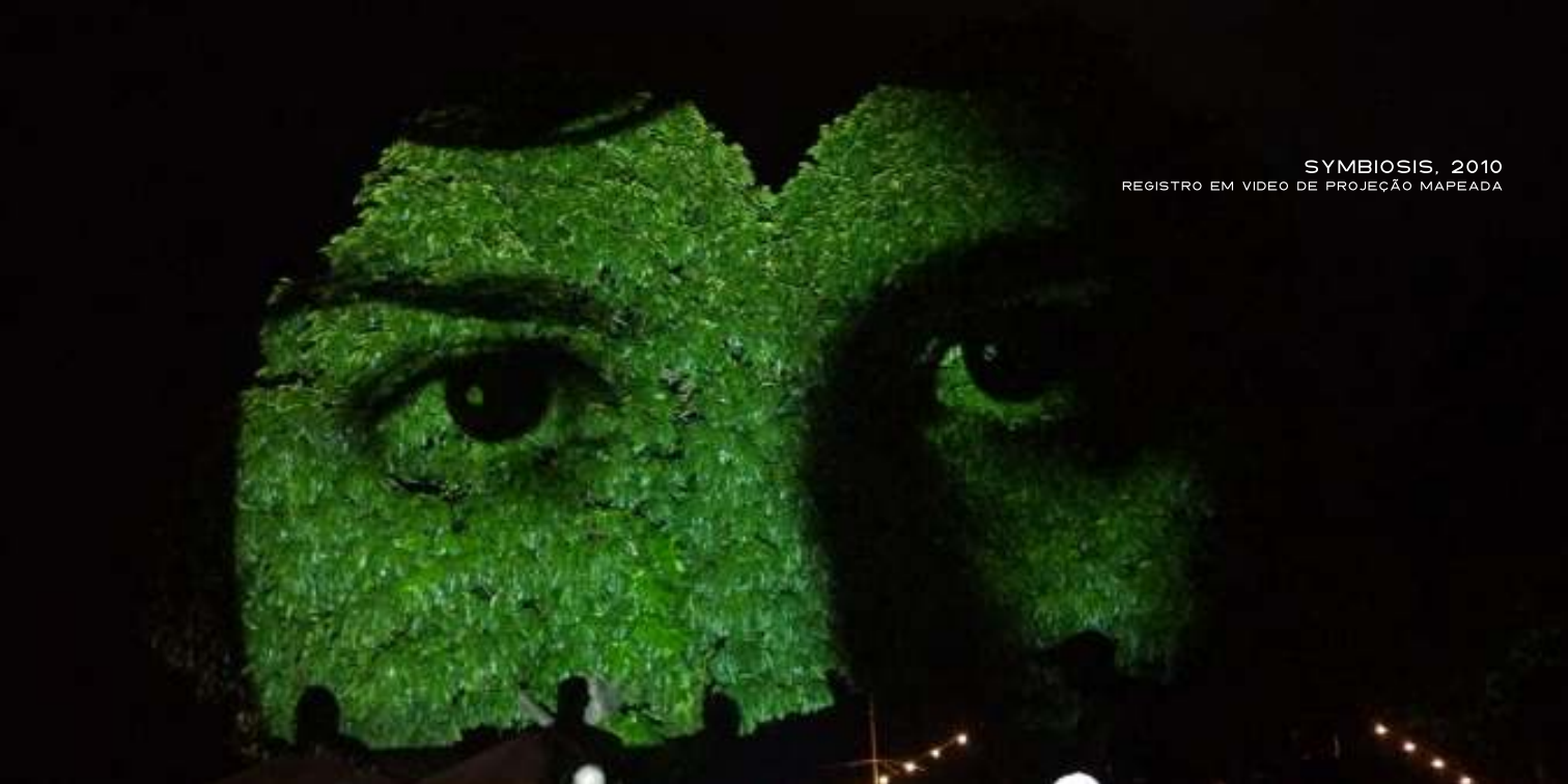
SYMBIOSIS, 2010 REGISTRO EM VIDEO DE PROJEÇÃO MAPEADA