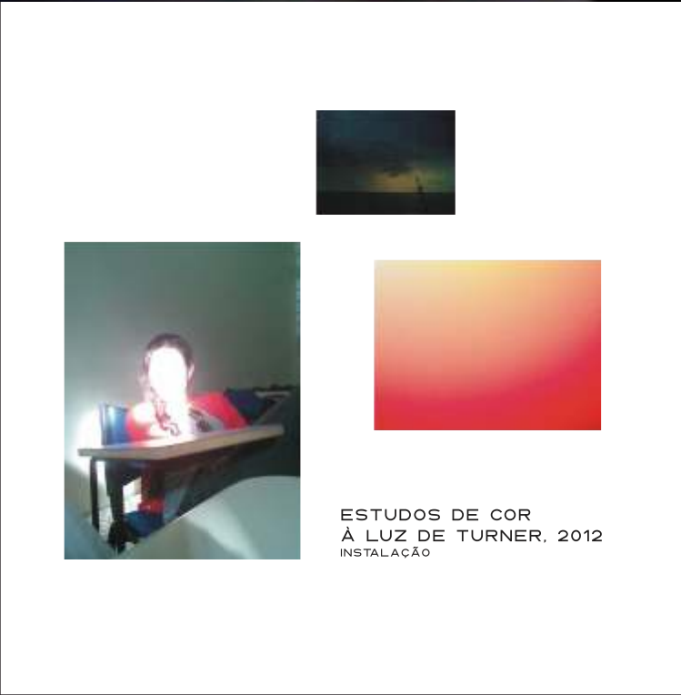
ESTUDOS DE COR À LUZ DE TURNER, 2012 INSTALAÇÃO